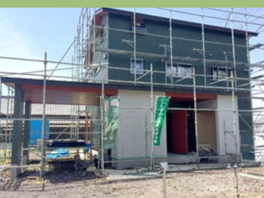
5月19・20日(土、日)に完成見学会を予定しております。珪藻土の塗り壁の心地よさは是非体感しにいらして下さい。詳しくはロハスHPをご覧ください。

虫たちがどんどん目覚める季節になってきました。庭のローズマリーも元気に伸びてくる季節です。このローズマリーを少し摘んできて。うちでは、15分ほど煮出したローズマリー水を、木の床を拭くのに使っています。ローズマリーは虫除けや殺菌作用があり、何よりローズマリーを煮出した時のいい香りが部屋に充滿して、お掃除が少し楽しくなりますよ。雑巾にハーブの精油を垂らすのもいいですが、庭にローズマリー。いかがですか? 「ガーデンコング」には思いがけないオマケが、 まず「ガイエト」をしながらもスタイルが保てます。 ターニャ