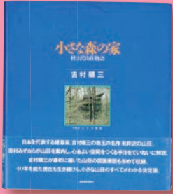
「小さな森の家」建築資料研究社