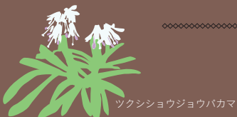
ツクシショウジョウバカマ