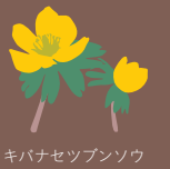
キバナセツブンソウ