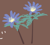
コキクザキイチゲ